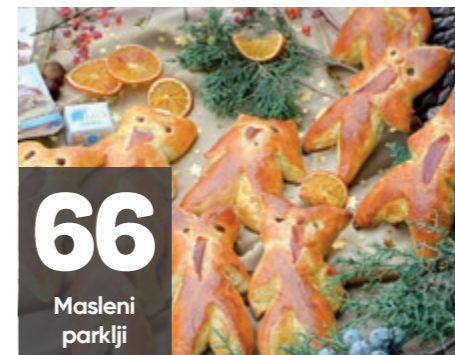
66 Masleni parklji