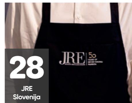
28 JRE Slovenija