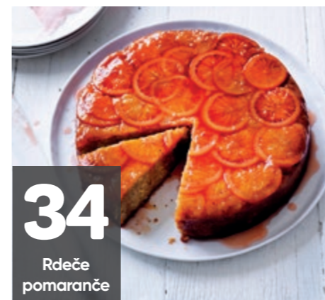
34 Rdeče pomaranče