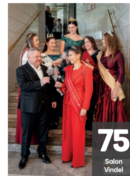
75 Salon Vindel

KVIZ: Gurman tudi po znanju »IZ SLOVENSKE KUHINJE«