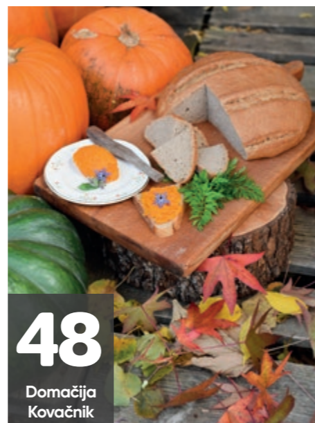
48 Domačija Kovačnik