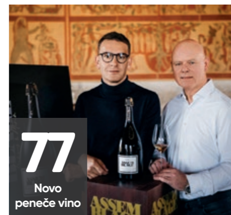
77 Novo peneče vino