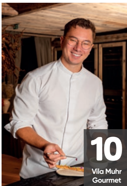
10 Vila Muhr Gourmet